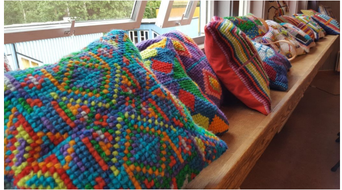
Putene er laget av 5. klasse i år

D en siste mandagen, mandag 20.06, skal vi i 5. klasse på tur med 2b. Vi skal til Ursvik for å bade!