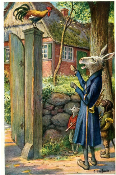
Brüder Grimm Die Bremer Stadtmusikanten © Herrfurth pinx

Mandag: bivoksmodellering; tirsdag: håndarbeid; onsdag: eurytmi og torsdag maling. På fredager er det tur til 12:30, deretter er det fri lek til ca. kl. 11, da er det måltid og eventyr. Ca. kl. 12:15 kler vi godt på oss og takker for skoledagen ute foran skolen.